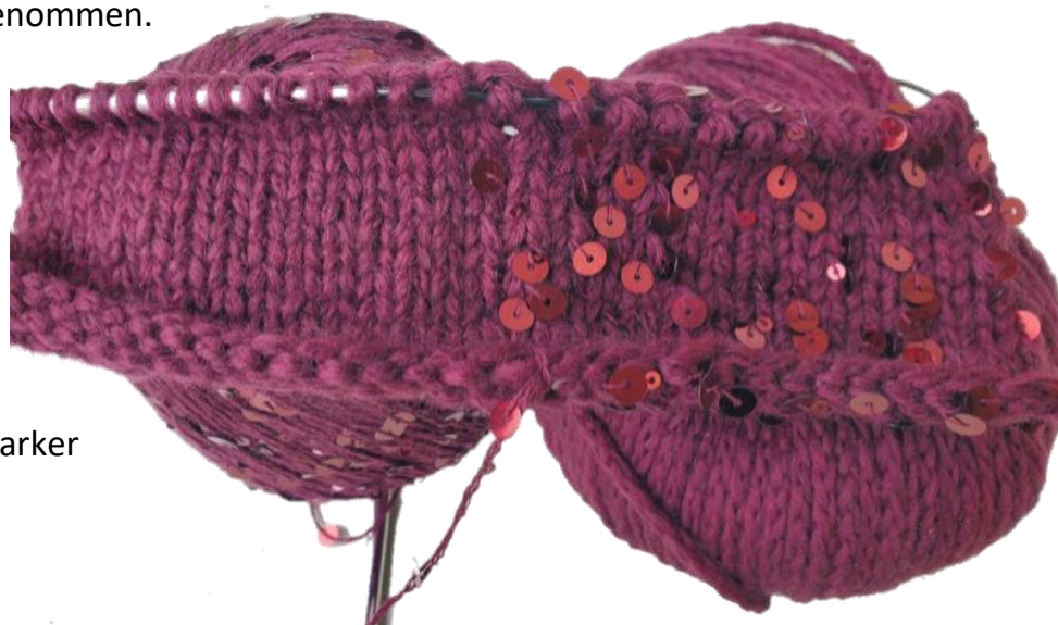
Abb. ohne Marker

Mit je einem Faden Cool Merino Big und Cosmo 10 Maschen anschlagen, dann die Cosmo hängen lassen und nur mit der Cool Merino Big weitere 11 Maschen anschlagen = 21 Maschen. Nun in der ersten (Rück)Reihe 11 Maschen links nur mit der CMB, dann den Markierer einhängen (der wird dann immer nur abgehoben) die Cosmo wieder dazu nehmen und 10 Maschen links stricken. Nächste (Hin)Reihe alle Maschen rechts stricken. Es wird in den rechts gestrickten Hinreihen immer bis zum Marker mit der Cosmo gestrickt, dann wird sie hängen gelassen und in der folgenden Rückreihe wird sie nach dem Marker wieder dazu genommen.