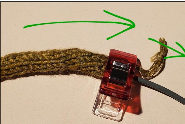
Vor dem Zusammennähen die Schläuche noch einmal zu den Enden stramm ausstreichen!