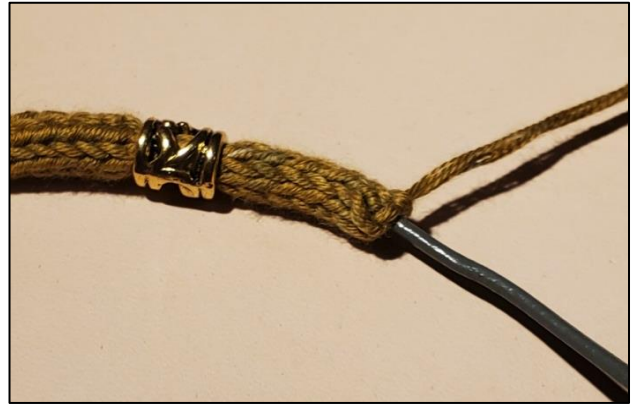
Die Perle aufziehen.