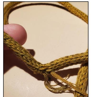
Dann die offenen Maschen im Maschenstich an das andere Ende nähen. Fäden vernähen.