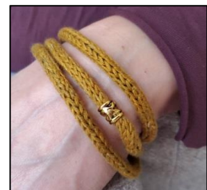
Perle auf die Nahtstelle schieben.